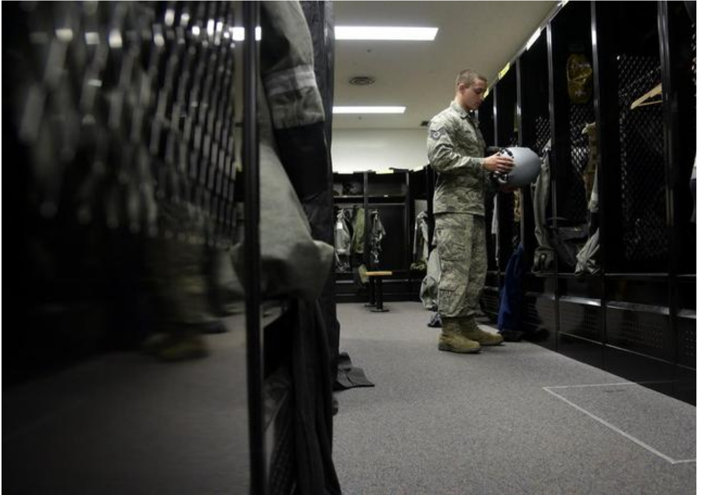
资料图：驻日本三泽空军基地的美军公开一批日常训练照片

据日本共同社11月30日报道，日本政府计划于今年12月8日，即日本联合舰队偷袭美国夏威夷珍珠港75周年之际，与美国共同举行纪念活动。这是日美首次就珍珠港事件举行联合纪念活动，被认为是两国对外彰显“历史和解”的重要表现。日本时事通讯社称，在特朗普共和党政权上台后，日美关系面临较大的不确定性，除战略与政策层面的差异外，历史问题此前也是日美关系暗埋的导火索之一。在日本看来，尽可能确保日美同盟稳定，体现“对外一致”成为当务之急。