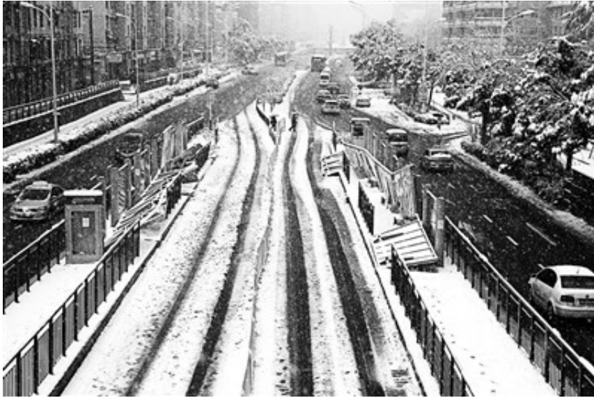
大雪中，合肥市望江路陆续有16处BRT公交站台顶板倒塌

1月4日，安徽省合肥市望江路上16处BRT公交站台顶板在大雪中倒塌，造成27人受伤、1人死亡。同在一城，为何其他公交站都未发生事故，偏偏望江路上连倒16处？这到底是天灾还是人祸？目前，合肥市委市政府已成立联合调查组，彻查事故原因，合肥市城乡建委组织设计、施工、钢结构等业内专家，已到现场查勘、调取工程资料。