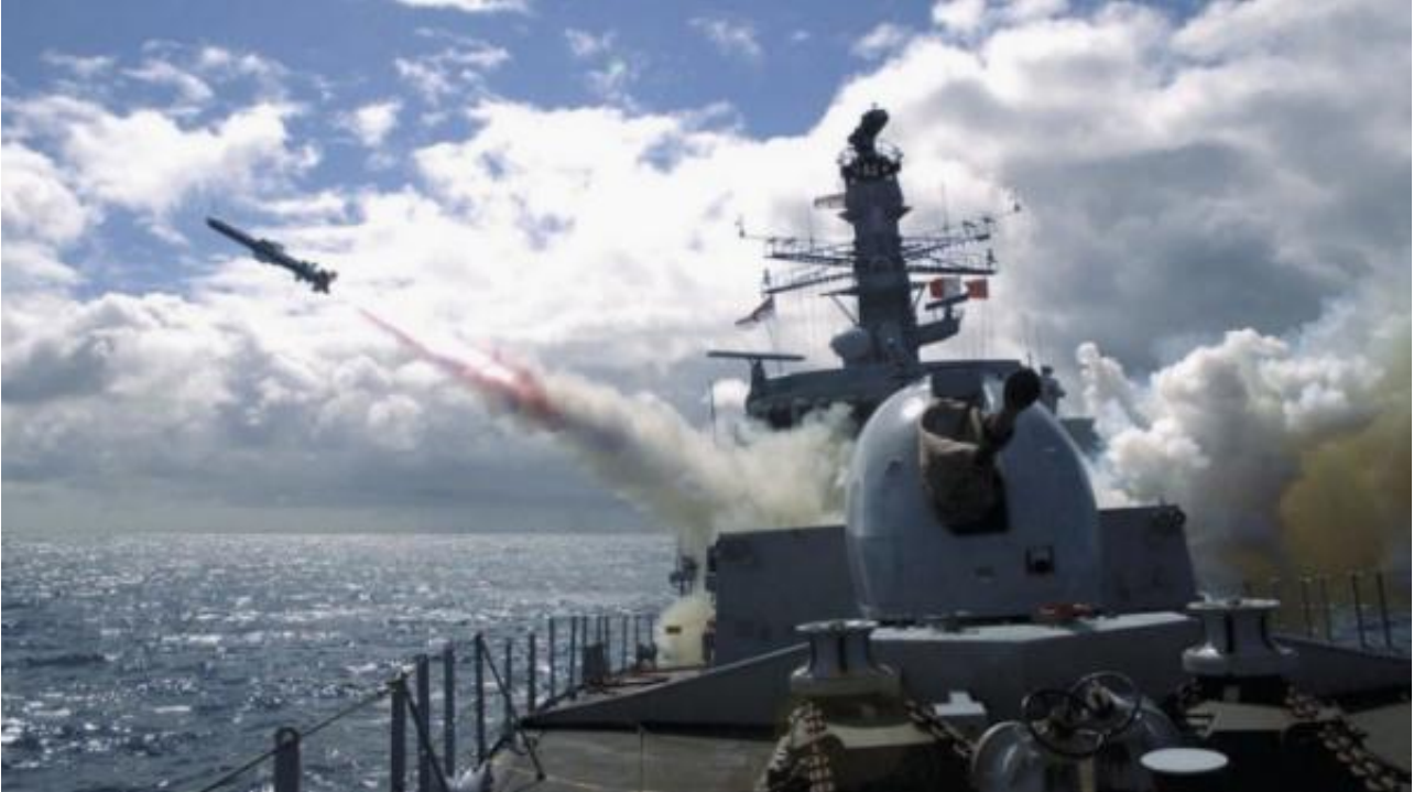
英国海军的“鱼叉”导弹

“鱼叉” Block 1C导弹是一种涡轮喷气发动机动力的掠海反舰导弹，该导弹射程约为130公里，使用雷达制导。