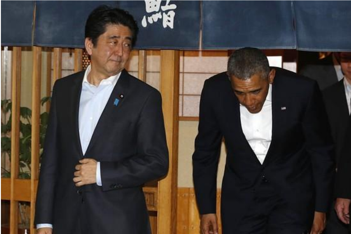
2014年4月，安倍与奥巴马一起在东京一家寿司店用餐

消息人士还透露了美日两国就此问题进行交涉的一些细节。相关人士称，美国在11月左右通过外交渠道告知日本，对在东京举行日俄首脑会谈“表示关切”。美国还不满地对日本表示，七国集团（G7）当前对俄罗斯采取制裁。如果作为G7一员的日本在此时欢迎款待普京，势必会传递出“G7并非团结一致”的错误信息。