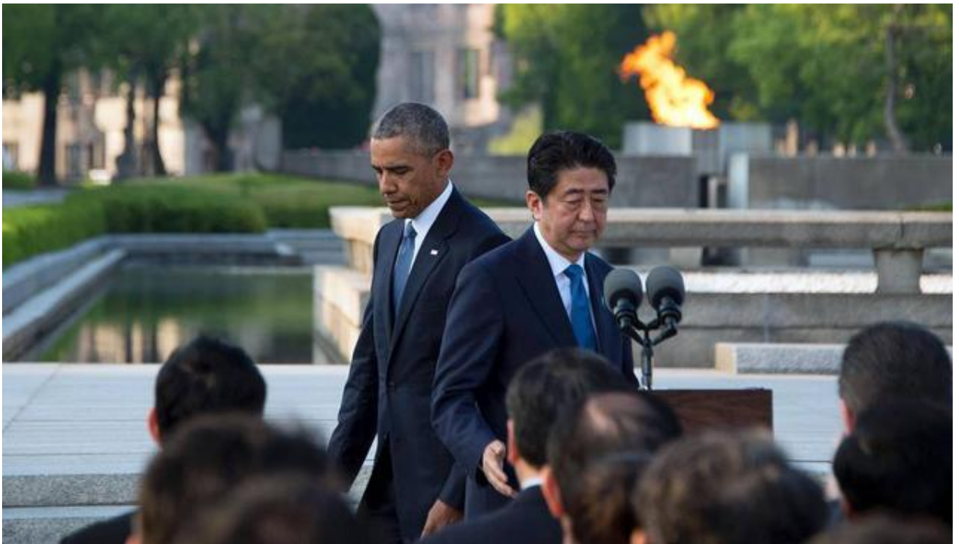
今年5月，奥巴马访问日本广岛

共同社援引多名日美关系消息人士透露，美国当时告知日本，如果日方邀请普京前往首都东京并给予礼遇，日美欧三方的“对俄包围圈”将会发生松动。但日方并未同意，反而本月8日正式宣布将在东京举行会谈，这使得美方颇为不满。