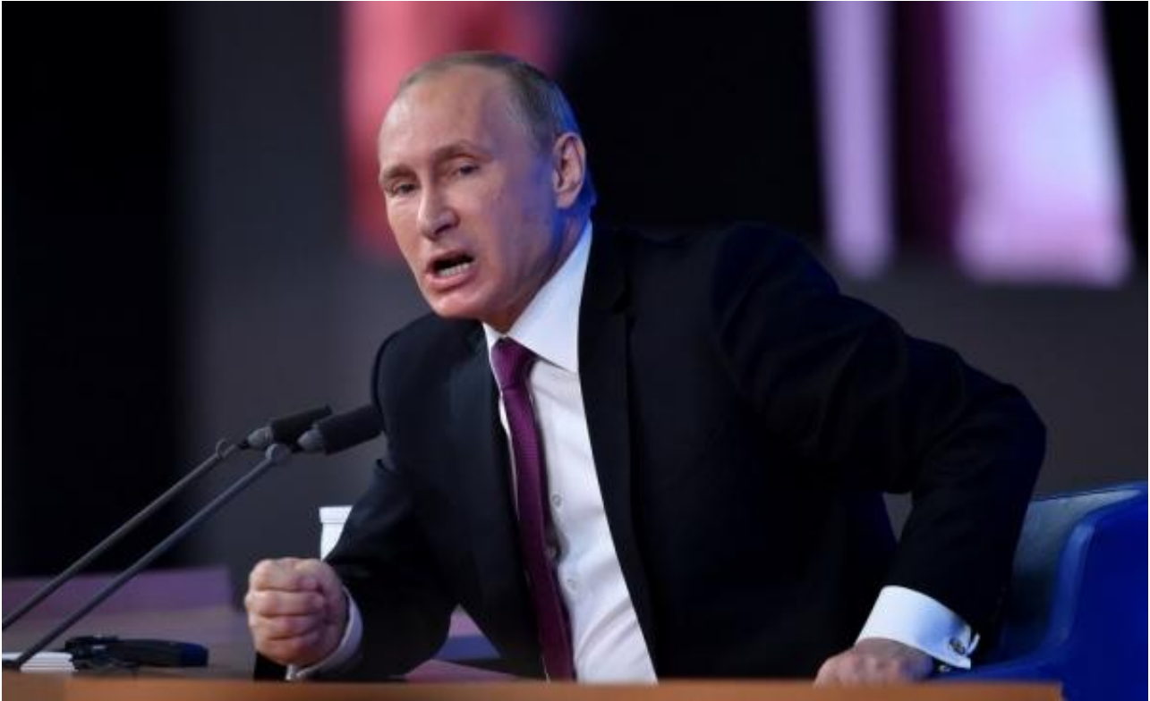
资料图：俄罗斯总统普京

新华社莫斯科11月30日电（记者张继业）俄罗斯总统普京11月30日表示，美国大选过后，俄方愿意相信俄美两国关系将会出现改善的契机。