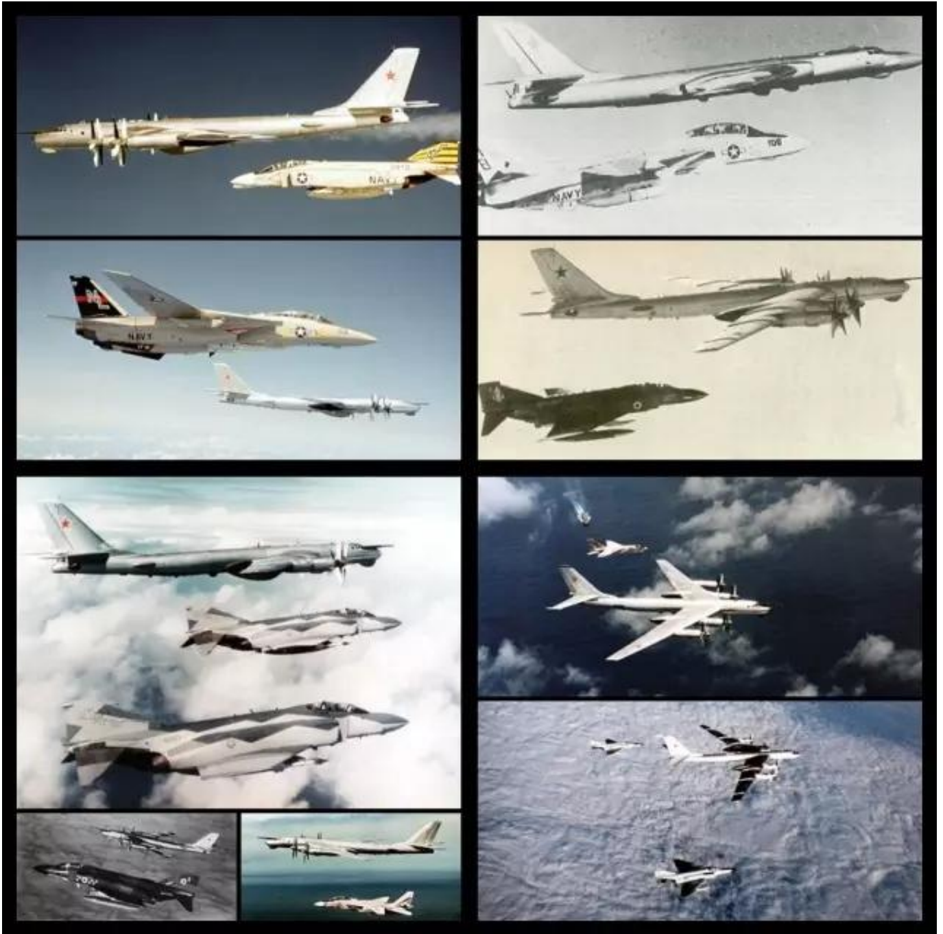
图：依次为上世纪60、70、80年代，以及本世纪图-95会过的部分西方战机，其中上世纪90年代忙解体，没空和西方玩儿。

值得注意的是，图-95MSM此次出动前不久（11月12日）刚好是图-95首飞64周年。这一甲子，图-95会遍了西方几乎所有主要战机。