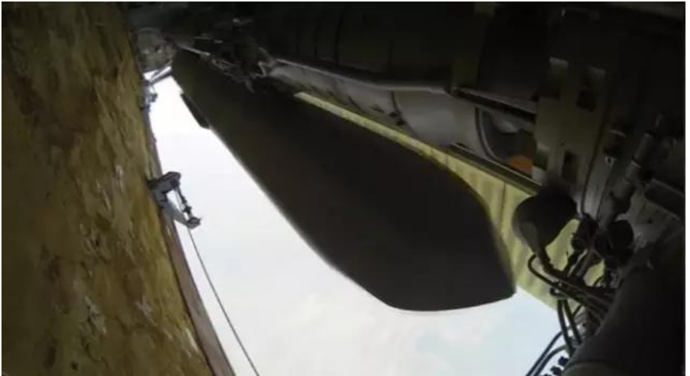
图：去年图-160在对叙行动中发射Kh-101

在这一背景下，2015年11月17-20日的连续4天，俄罗斯空天军出动5架图-160和6架图-95MS战略轰炸机，向位于叙利亚的极端组织怒射48枚Kh-101和35枚Kh-555常规战略巡航导弹。