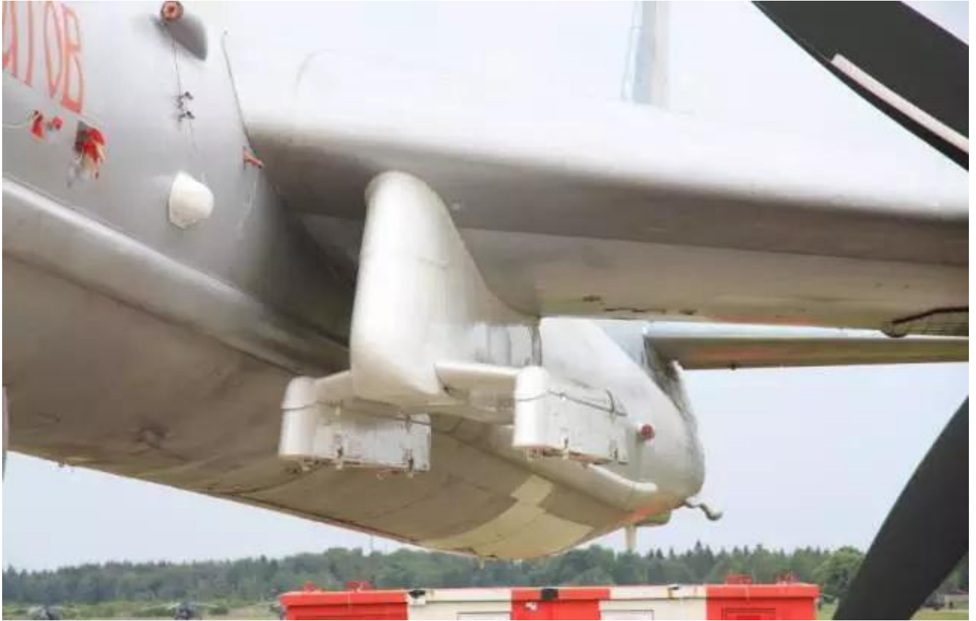
图：图-95MSM的专用挂架特写

值得注意的是，俄军称图-95MSM在行动中经过了2次空中加油，图-95不是号称航程超一万公里吗？怎么要加2次油？这背后涉及到一个问题——外挂导弹令图-95的航程大打折扣。