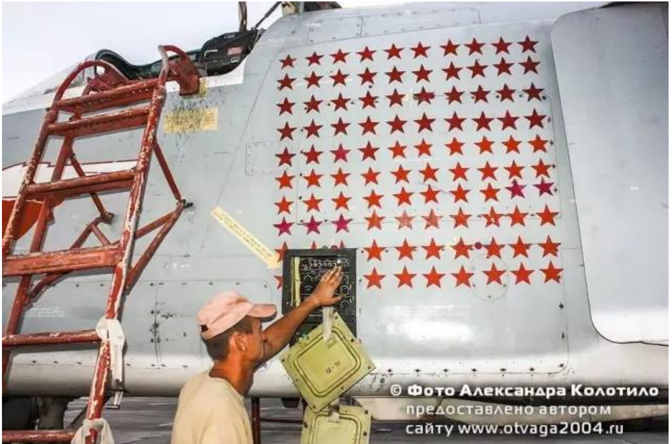
图：这架苏-24前线轰炸机在叙利亚的出动架次达到了惊人的1000架次

苏-35S护航并不稀奇，但飞机上的一个细节却值得注意，视频画面显示苏-35S机身上已经被涂上了至少35-40颗红星。