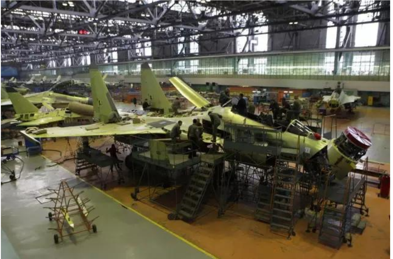
图：今年以往的苏-27/30维修雷达需要上翻雷达

苏-35S可维护性方面，前起落架舱就是一个典型例子。以往苏-27系列雷达的维护需要将雷达上翻而后将雷达前移，而维修苏-35S的“雪豹”-E火控雷达只需通过打开前起落架舱机首方向的舱门和机首侧面舱门即可，这大大简化了作业量。此外，通过前起落架舱还可以对其它一些航电设备进行简单维护。