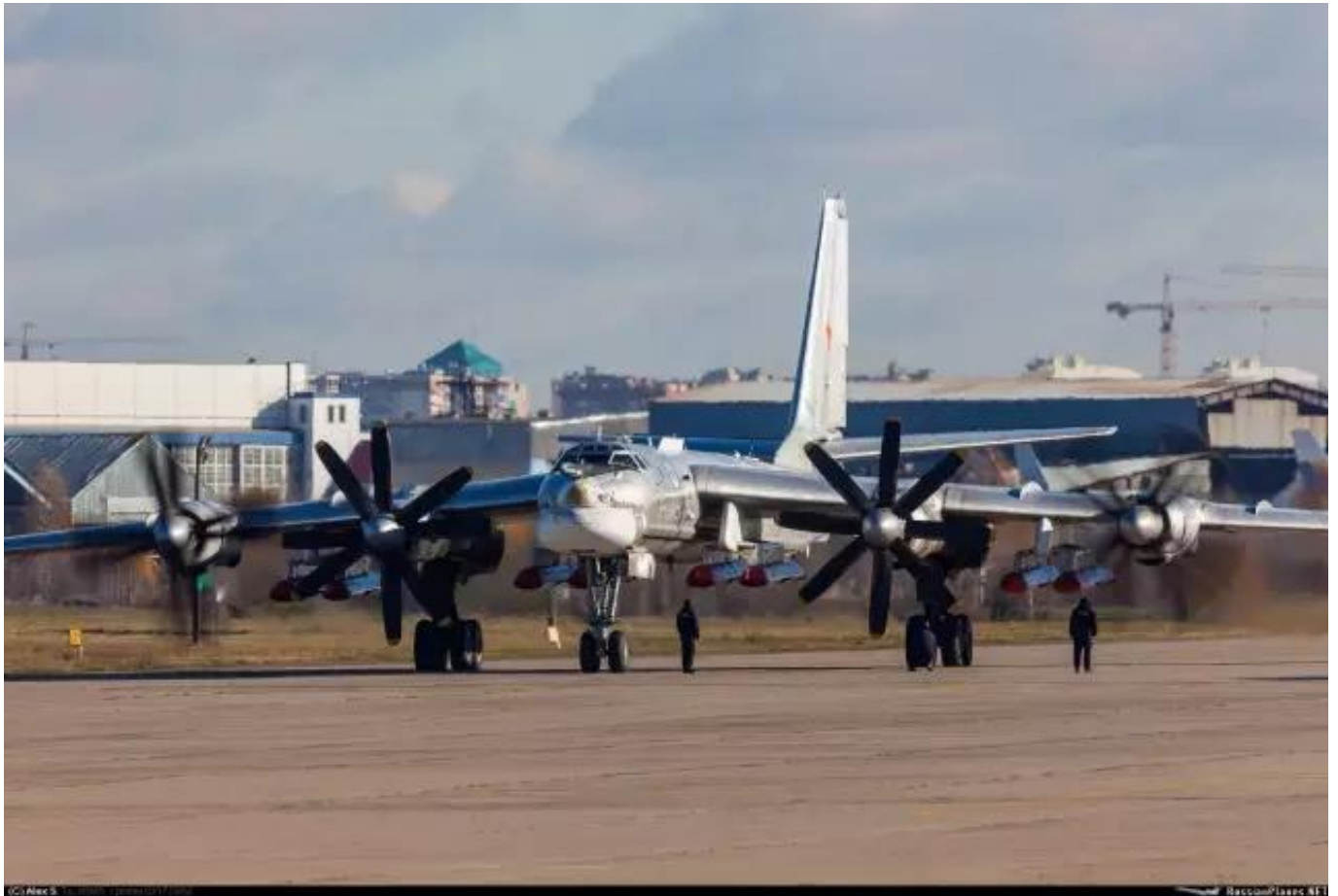
图：图-95携带8枚Kh-101/102的样子，阻力可想而知

具体会如何影响呢？北国防务（微信ID: sinorusdef）认为，这或许可以参照图-142，根据官方公开的信息，图-142在外挂6枚重600千克的Kh-35反舰导弹时，航程将下降20%；在外挂6枚重约2500千克（与Kh-101/102类似）的“宝石”/“布拉莫斯”反舰导弹时，航程将下降40%。以此推测，图-95在外挂8枚Kh-101/102时，其航程很可能只有7000千米（无外挂时航程约10500千米）。