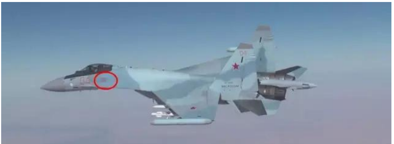
图：视频中的“红色04”号苏-35S，注意左侧前机身的星，应该有35-40颗