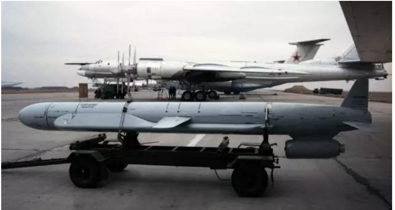
图：2003年前，带保形油箱的Kh-55SM是图-95的主要武器，主要用于核威慑

在适配Kh-555的同时，图-95也在进行适配Kh-101/-102新型导弹的工作。因为图-95的弹舱小无法容纳Kh-101/102，相关的改进工作较大，这也就是现在的图-95MSM。