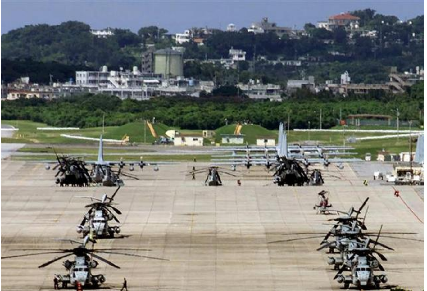
资料图：驻日美军冲绳基地内的战机

美国《星条旗报》17日称，美国专家普遍认为，新当选的美国总统特朗普上台后，不会大规模从海外撤军，因此他在竞选期间宣称日韩等国应当全额负担美国驻军费用的言论可能不只是“口头威胁”。那么现在驻日韩美军的费用是如何分担的呢？