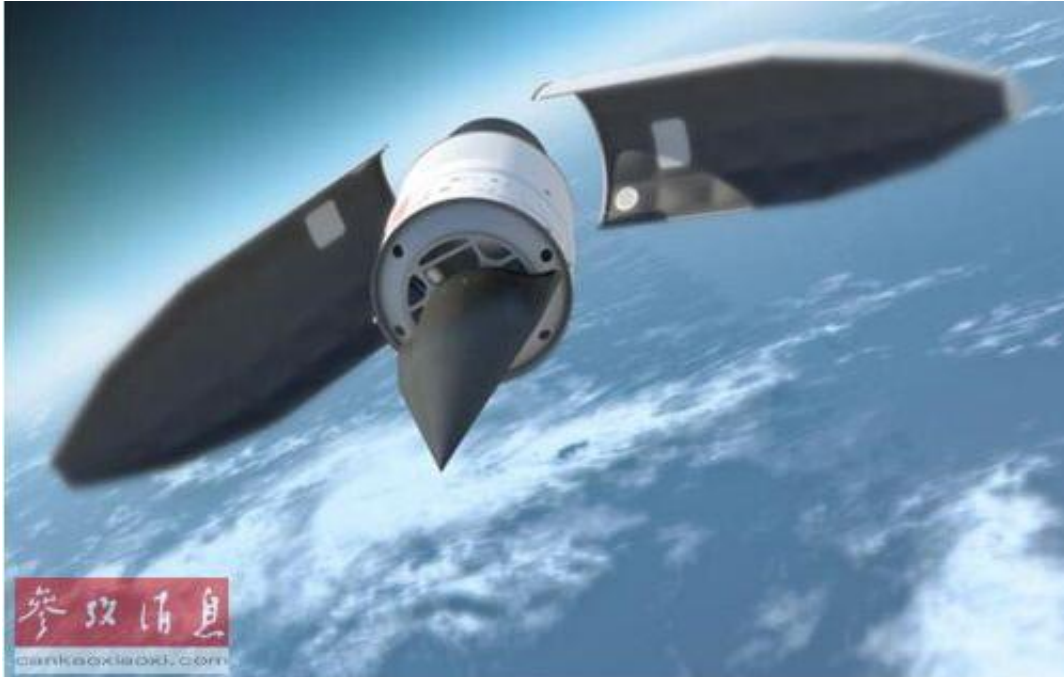
资料图：美国国防部研发的高超音速飞行器HTV-2构想图

参考消息网12月2日报道 外媒称，美国国家科学院空军研究委员会专家报告显示，美国易受到可能来自于中国和俄罗斯的高超音速导弹攻击，并在研制高速防御性和进攻性武器技术竞赛中落后。